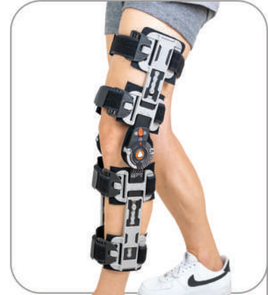
زانوبند پیشرفته POST OP