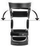
Adjustment of the Lateral angle