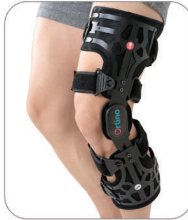
زانوبند یکطرفه آنلودر Unloader