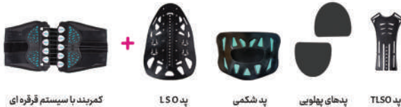
کمربند با سیستم قرقره ای