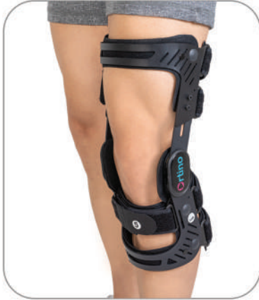
زانوبند دوطرفه Rebound Dual